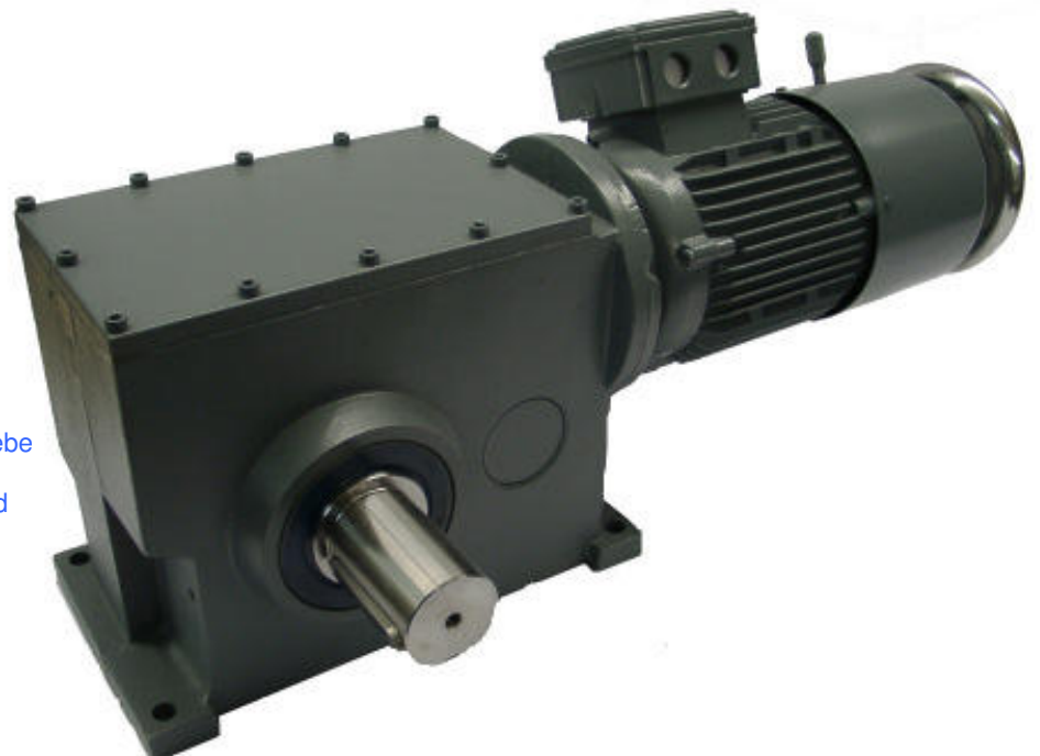
SSR 669 Schnecken-Stirradgetriebe mit Bremsmotor, Handlüftung und Handrad