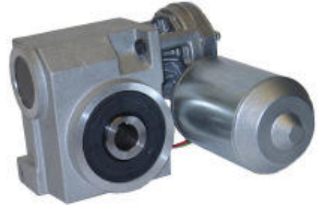
SM 674 Schneckengetriebe mit DC – Motor, Bremsse getriebeseitig mit Handlüftung