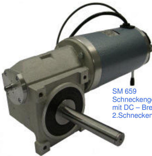
SM 659 Schneckengetriebe mit DC – Bremsmotor , Handlüftung und 2.Schneckenwellenende für Geberanbau