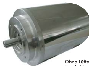
Ohne Lüfter (Ausf. OL)